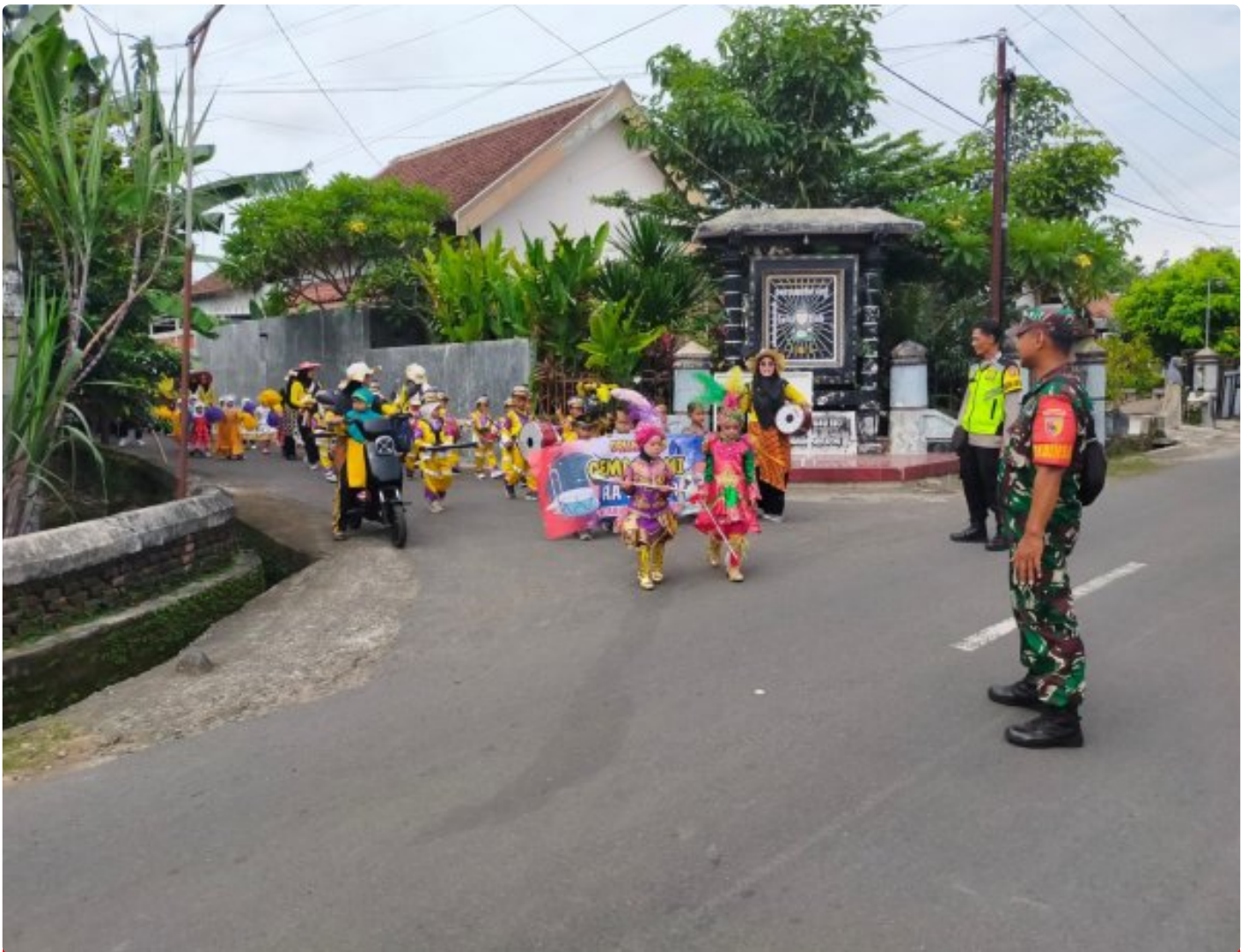
Gebyar Rojabiyah RA dan MI, Babinsa bersama Bhabinkamtibmas Amankan Jalannya Kegiatan Parade Drum Band