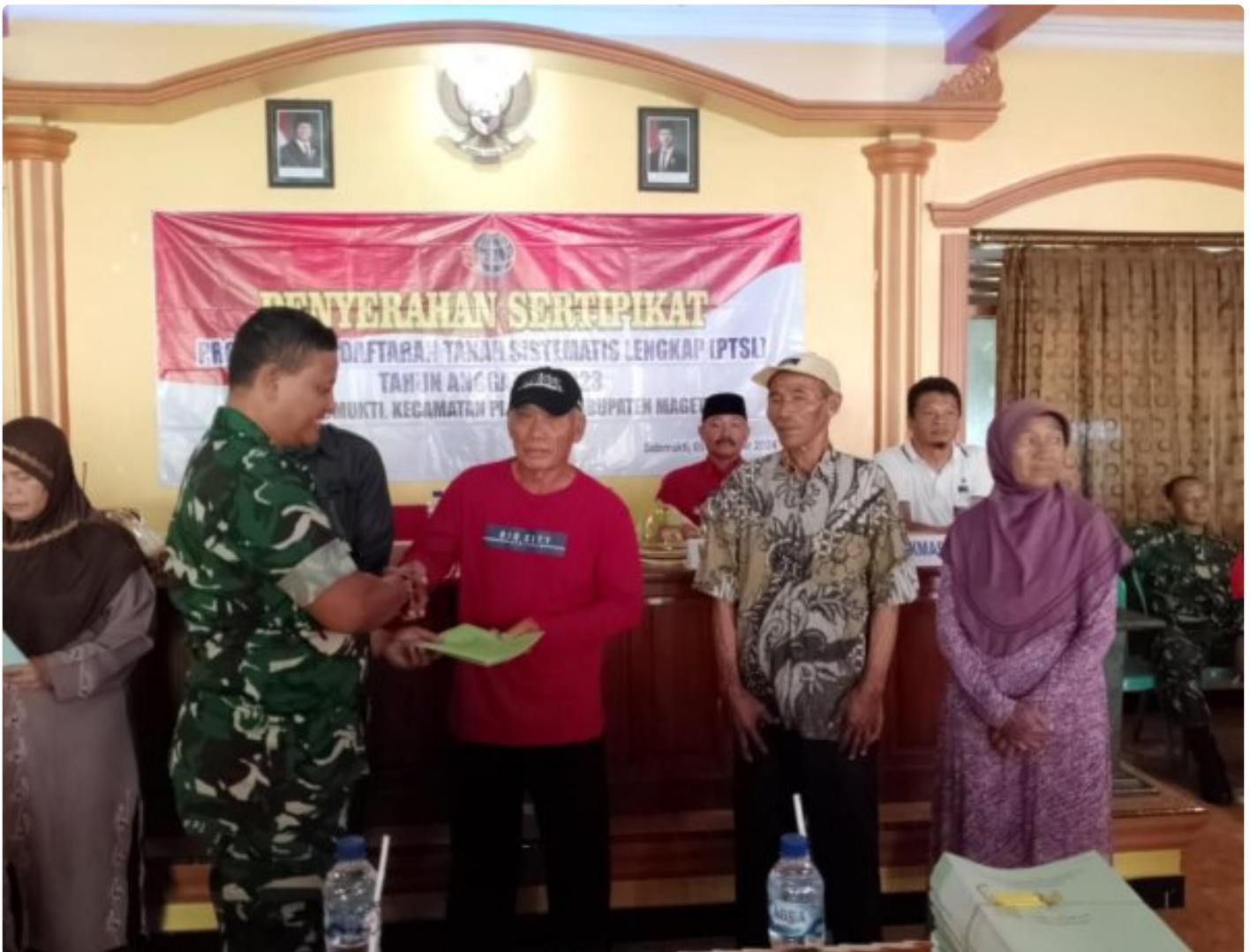
Danramil 0804/02 Plaosan Hadiri Penyerahan Sertifikat Program Pendaftaran Tanah Sistematis Lengkap (PTSL) Desa Sidomukti

PLAOSAN. - Desa Sidomukti melalui Badan Pertanahan Nasional (BPN) melakukan penyerahan Sertifikat Tanah Program Pendaftaran Tanah Sistematis