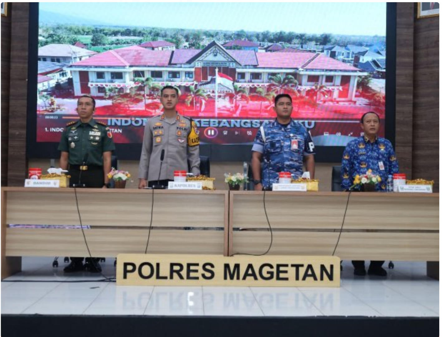
Dandim 0804/Magetan Hadiri Rakor Lintas Sektoral kesiapan operasi lilin 2024

Magetan. – Guna meningkatkan Sinergitas dalam rangka kesiapan operasi lilin 2024 pengamanan Hari Raya Natal 2024 dan Tahun Baru 2025 di wilayah Kabupaten Magetan yang aman dan kondusif.